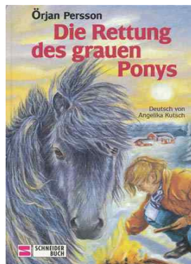
Omslag: Gertraud Funke