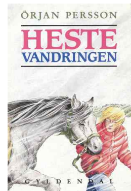
Omslag: Mette Langebæk